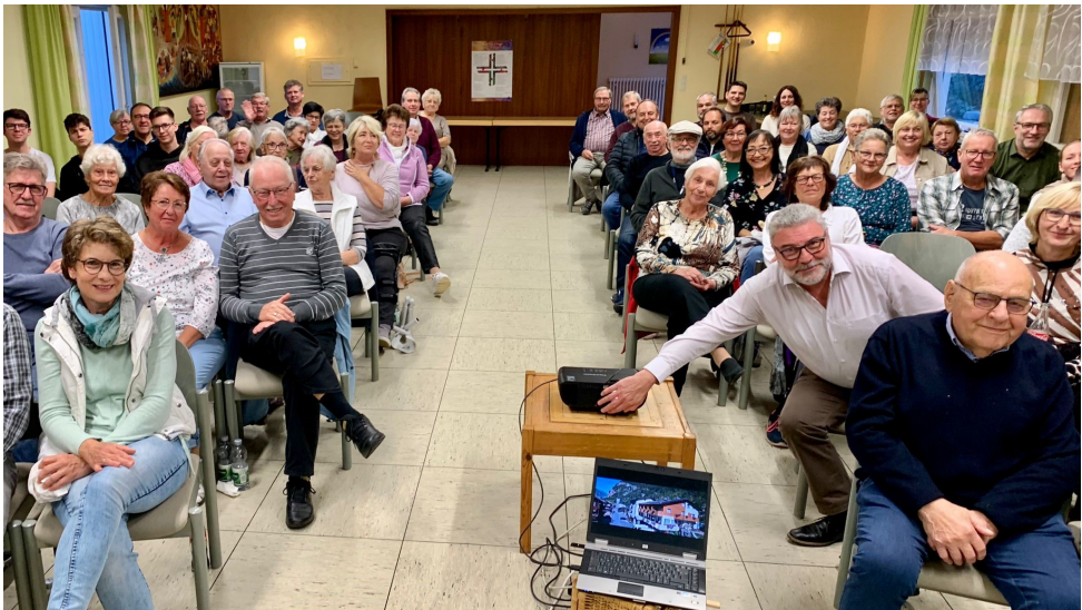
... und viele sind dem Ruf gefolgt!