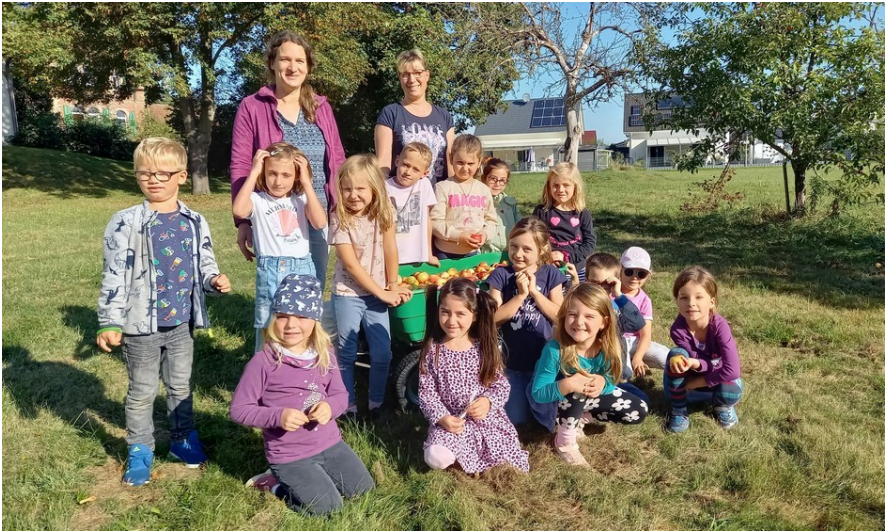
Apfelernte der Sternengruppe am Hans-Schwindt-Haus