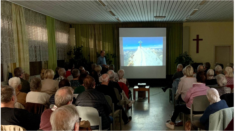
Zum letzten Mal ruft der Berg ...