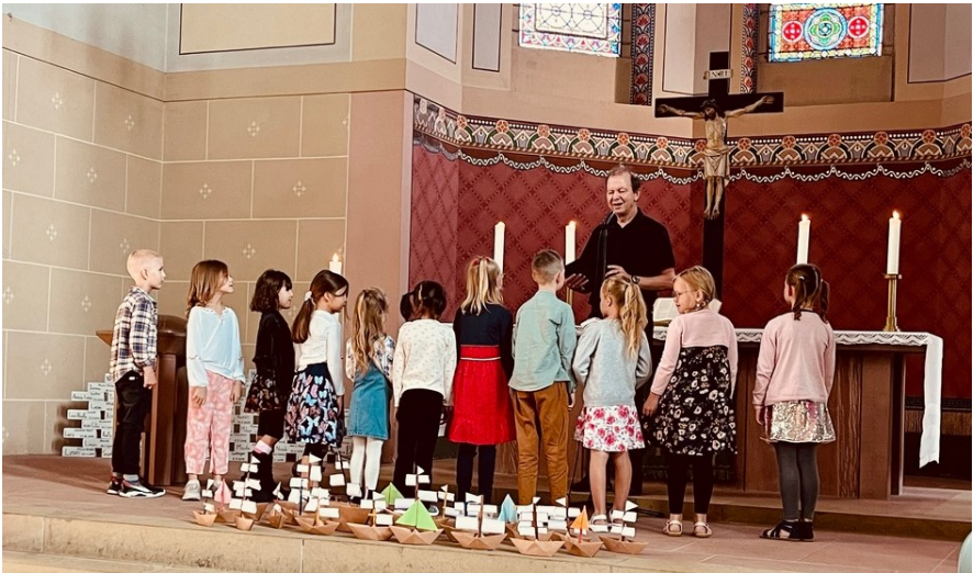
Gottes Segen für eine neue Lebensphase: Einschulungsgottesdienst