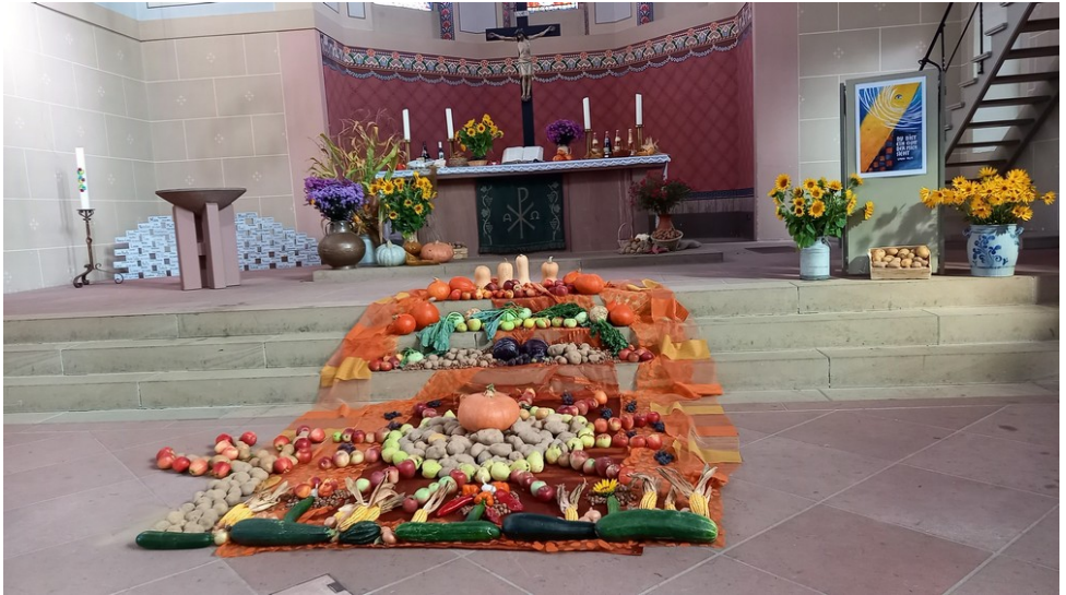
Ein Zeugnis der Dankbarkeit – unser wunderschöner Erntedankaltar