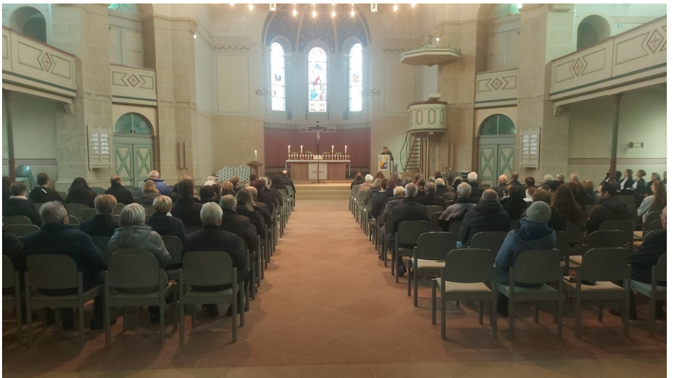
Totensonntag: ein Lichtermeer des Trostes und der Hoffnung